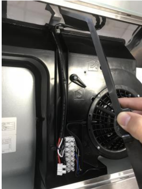
2 - Kabelabdeckung abheben

Wenn beide Schrauben entfernen sind, können Sie die Abdeckung einfach nach oben abnehmen.