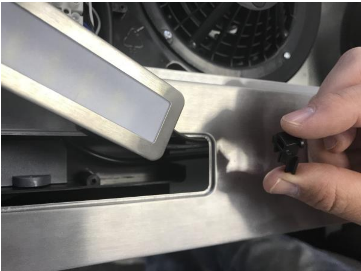
5 - Zugentlastungs-Element entnehmen

Das Zugentlastungselement ist ein kleines Kunststoff-Teil, welches seitlich in der Wand der Kabelbox steckt. Es kann einfach nach oben abgezogen werden.