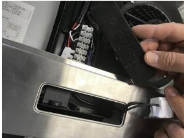
4 - Abdeckung Kabelbox entnehmen