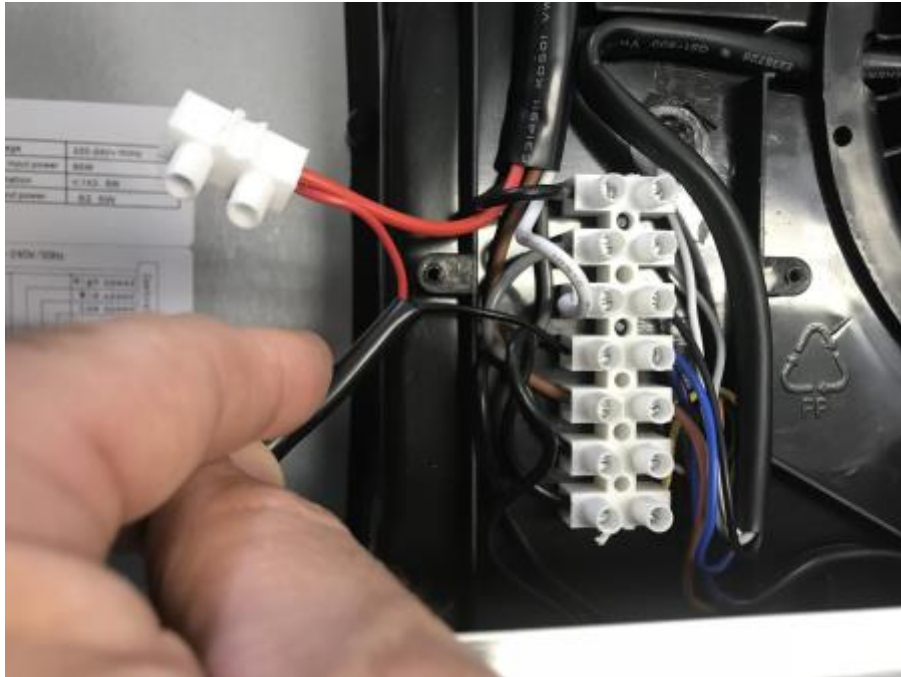
6 - Verkabelung lösen

Die Verbindungen der Leitungen des Leuchtmittels an der Lüsterklemme lösen und neues Leuchtmittel an der Lüsterklemme anschließen. Achten Sie darauf das beide Leitungen fest mit den Lüsterklemmen verbunden sind.